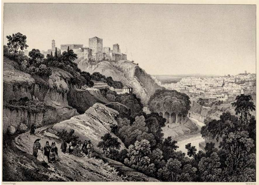
Camino de la Fuente del Avellano. Girault de Prangey, 1837