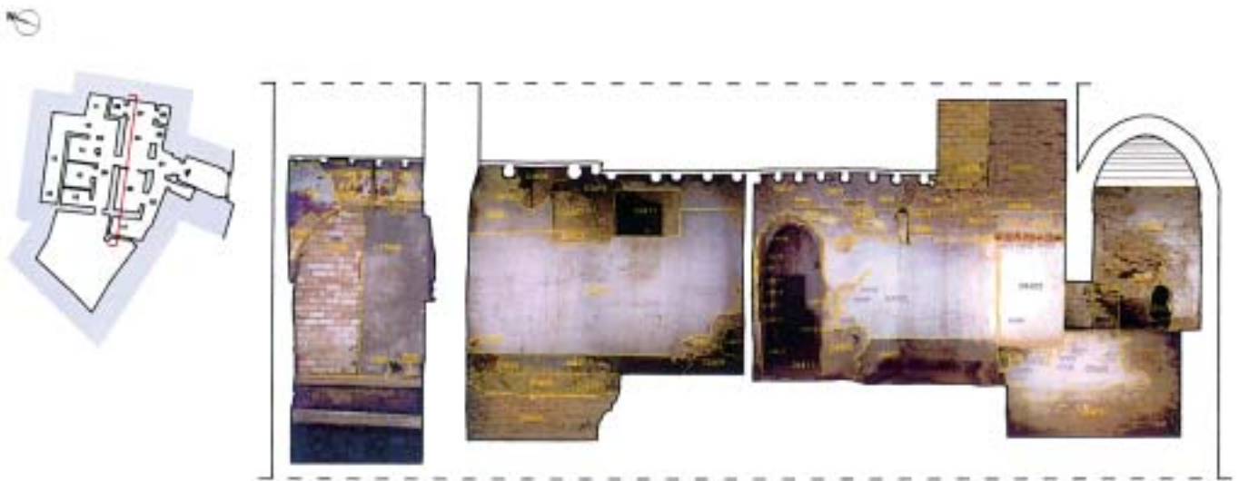
Fig. 1. Plano de análisis estratigráfico. Sección longitudinal de los Baños Árabes de Hernando de Zafra (Granada)