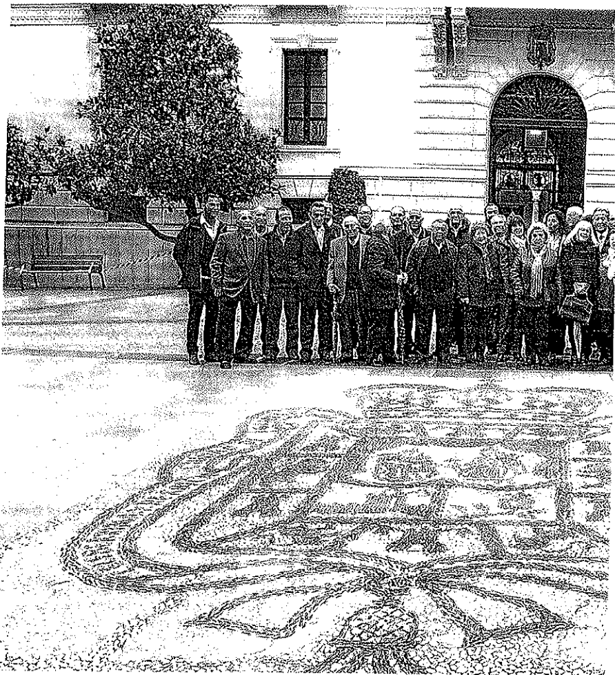
Una amplia representación de las asociaciones de vecinos y de los concejales del Ayuntamiento de Granada,