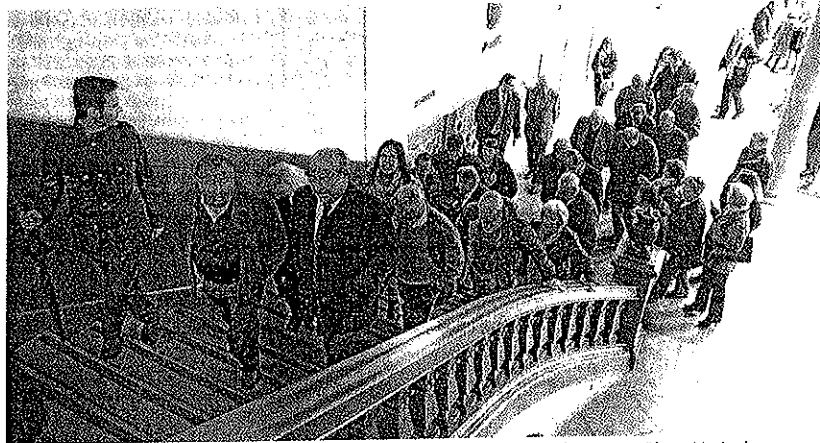
Concejales y presidentes vecinales suben a la planta noble del Consistorio para un Pleno Vecinal.