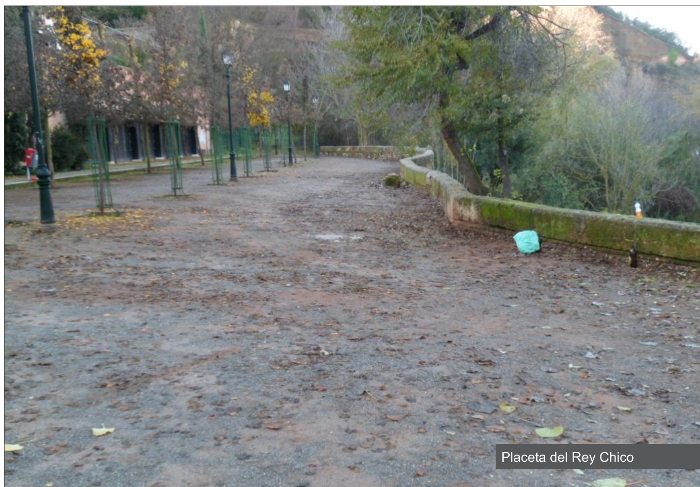
Placeta del Rey Chico

En fin, aquí está la adjudicación, a ver si para año nuevo tenemos inauguración.