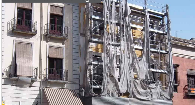
Andamio con nueva apariencia