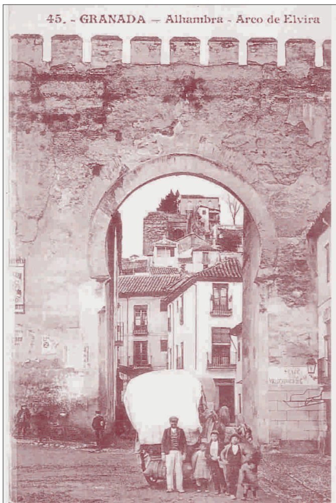
Puerta de Elvira hacia los años 20.

Estos datos no pretenden más que poner de manifiesto la importancia que tuvo durante muchos siglos esta Puerta para la ciudad. Y "¡Ahí está!, viendo pasar el tiempo" como cantaba Ana Belén, refiriéndose a otra puerta. Ahora ¡Por fin! se va a terminar su restauración, que tanta falta le hacía, para que podamos disfrutarla los que estamos y los que vienen. Se quitarán las vallas y podremos verla en toda su grandiosidad. Más vale tarde que nunca. Hemos protestado muchas veces y al final aunando las voces conseguimos cosas positivas para todo el mundo. Se van a terminar las obras y parece que va en serio. Va a quedar como lo que tiene que ser: Un sitio emblemático de la ciudad, un sitio para el disfrute de los sentidos. Recuperamos y adecentamos parte de nuestra historia.